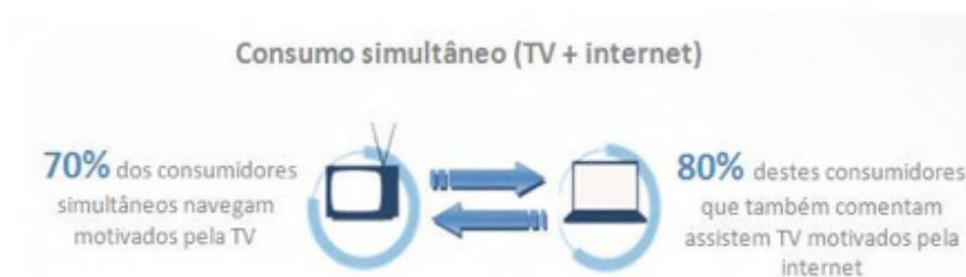
Infográfico: Pesquisa Social TV, IBOPE Nielsen Online

naquele momento. Uma esmagadora maioria de usuários reconhece que ligou a televisão ou trocou de canal a partir de uma mensagem recebida pela internet (Infográfico 1).